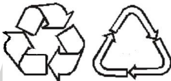
Рисунок 4 – возможность утилизации использованной упаковки (укупорочных средств) – петля Мебиуса