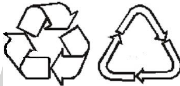
Рисунок 4 – возможность утилизации использованной упаковки (укупорочных средств) – петля Мебиуса